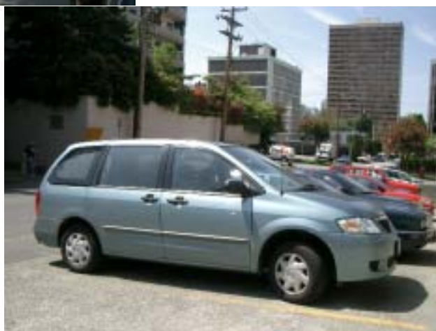
一番手前がCANの車(上と同じデポにて)