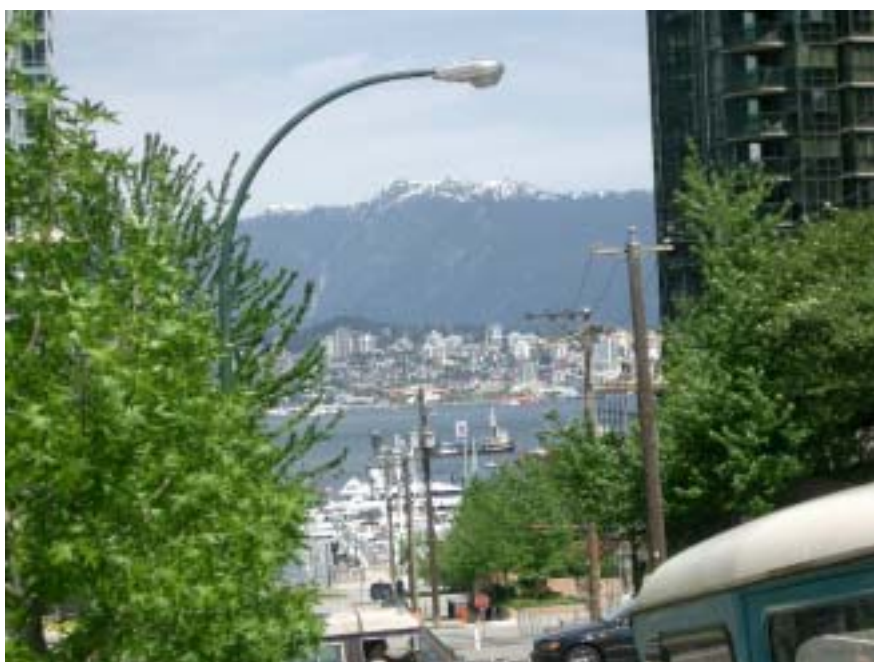
CANが事業を展開するカナダのバンクーバー市

CANは1997年に協同組合として設立され、組合員に対するカーシェアリング・サービスを提供しています。英語圏では世界初のカーシェアリング組織で、組合員数は1180人、車両は62台、デポ（駐車ステーション）は60カ所、スタッフは7人です。組合員になるための出資金は500ドル（無利息、無配当。脱退時に返還）登録料は20ドル。