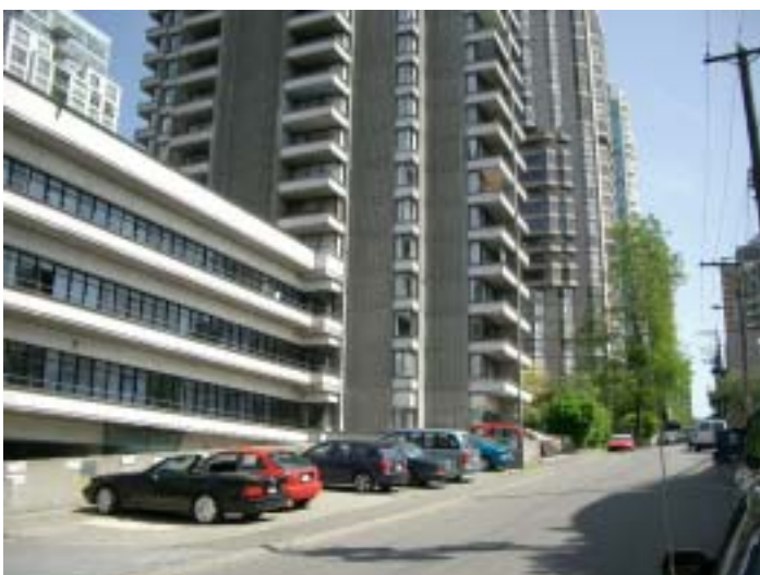
中心市街地の西側で、高層マンションとオフィスの混在する地区にあるデポ(一般駐車場の一台分を使用)

デポの2/3は市の駐車場を利用(有料)し、残りが民間の駐車場です。バンクーバー島などにもデポがあり、事務所から200km以上離れているところもあります。遠方にある車の点検は、その近所の組合員に委託してやってもらっています。