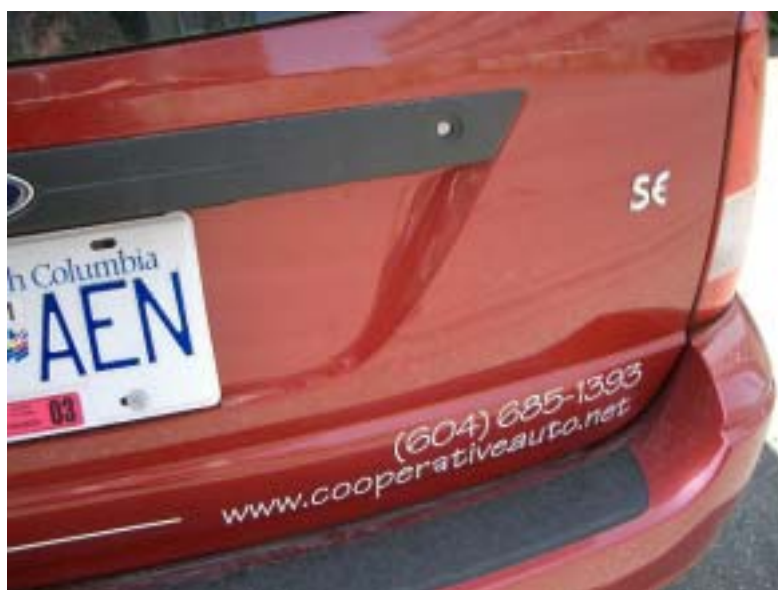
CAN の車であることの表示・・・あまり目立ちません

市には駐車場付置率の規制がありますが、ディベロッパーが市と交渉して緩和してもらったようです。