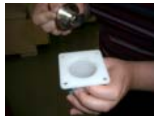
車体にはめ込まれているキーボックスの見本